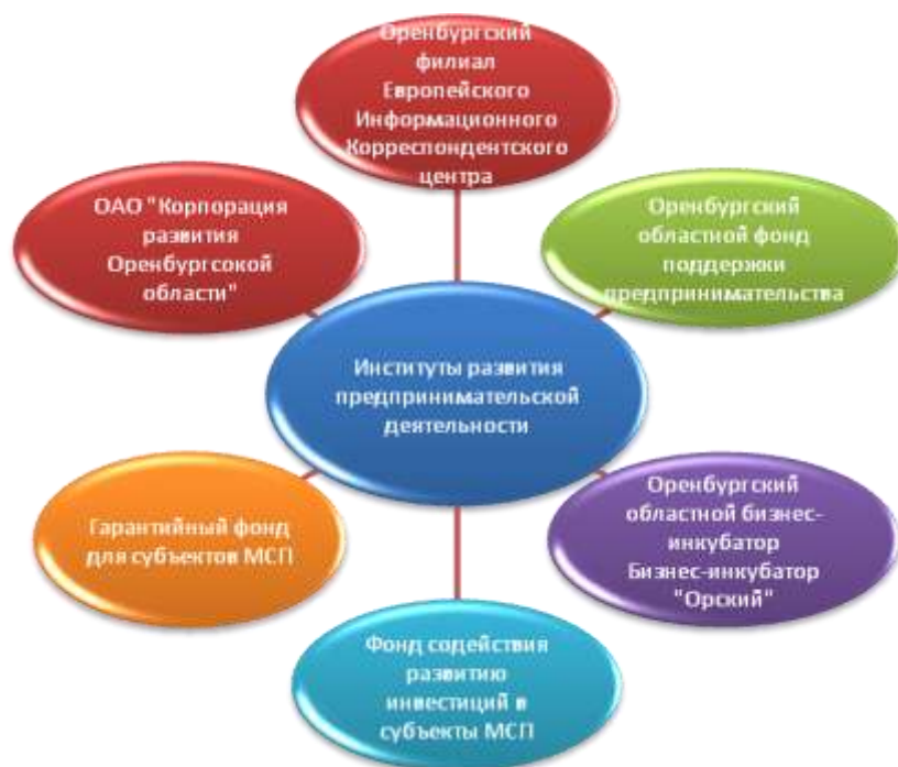
Рисунок 4. Уполномоченные организации (институты) по поддержке и развитию инвестиционной деятельности

В области действуют уполномоченные организации (институты) по поддержке и развитию инвестиционной деятельности.