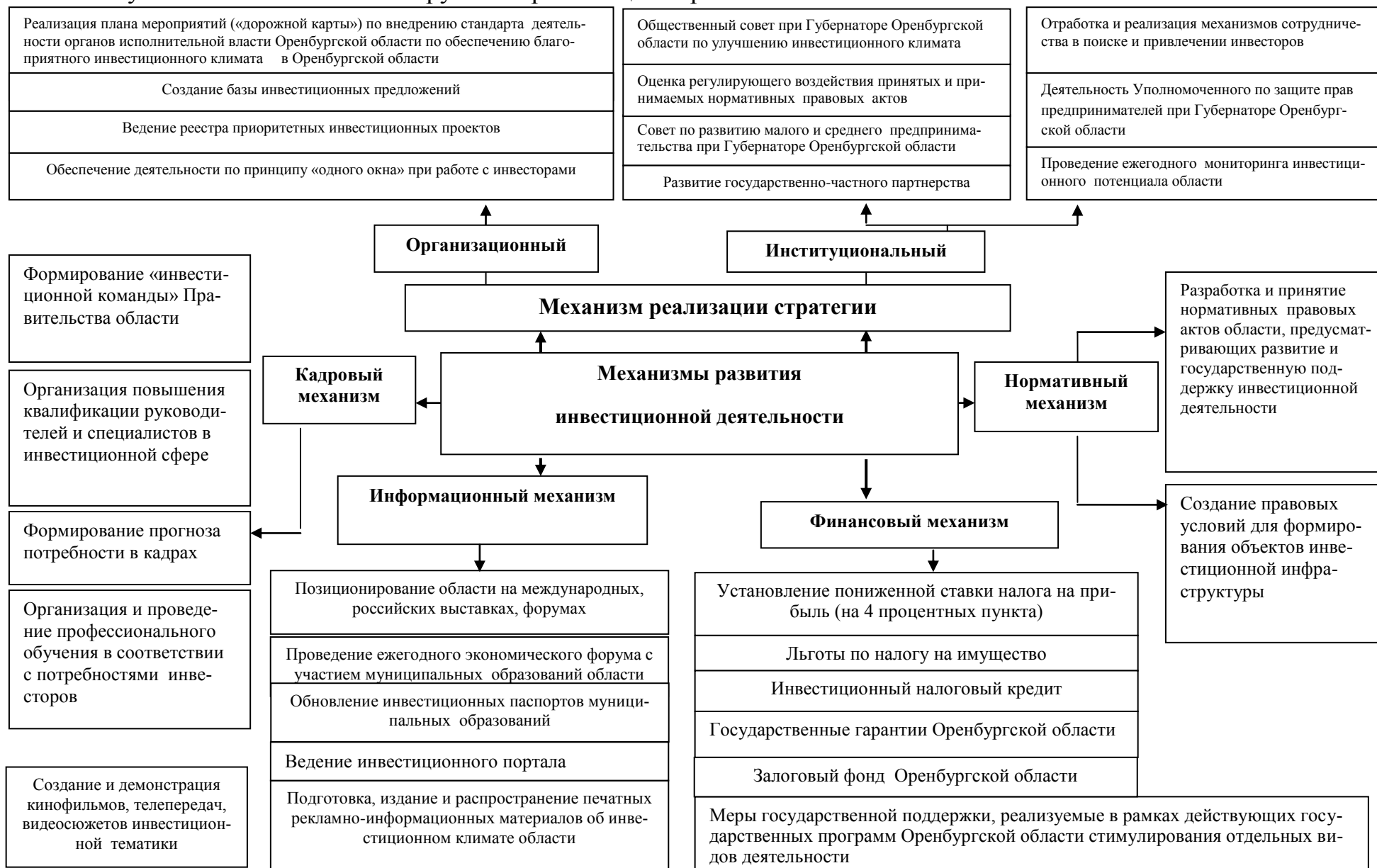
Рисунок 5. Механизмы и инструменты реализации стратегии