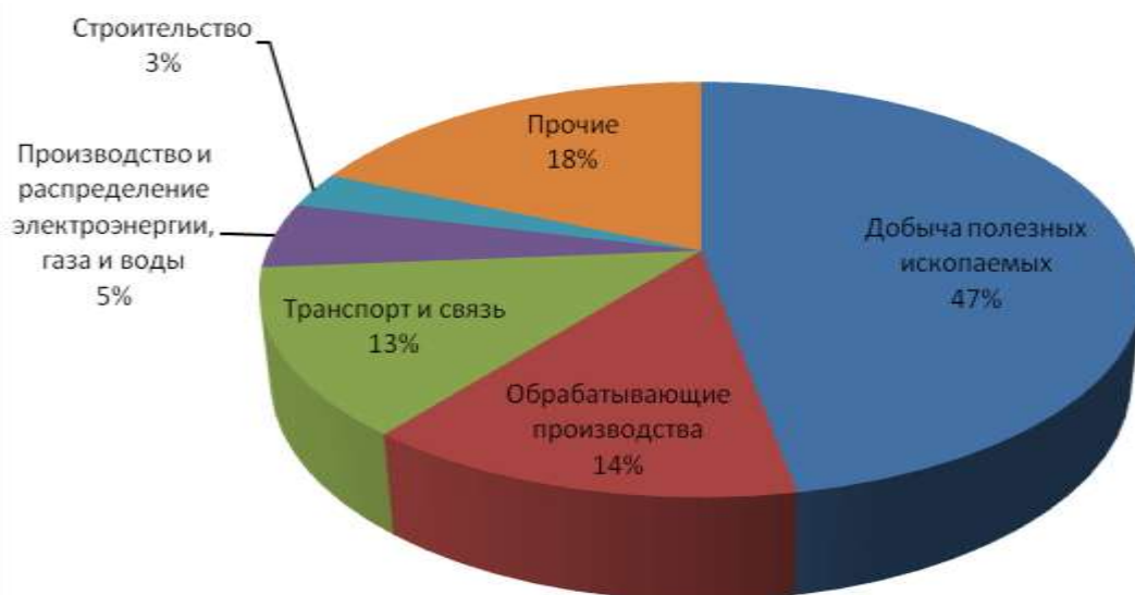
Рисунок 2. Отраслевая структура инвестиций в основной капитал

В 2013 году Оренбургская область подтвердила свой рейтинг, присвоенный международным рейтинговым агентством Fitch Ratings, долгосрочные рейтинги в иностранной и национальной валюте на уровне «BB», краткосрочный рейтинг в иностранной валюте «B» и национальный долгосрочный рейтинг «AA-(rus)», прогноз «Позитивный».