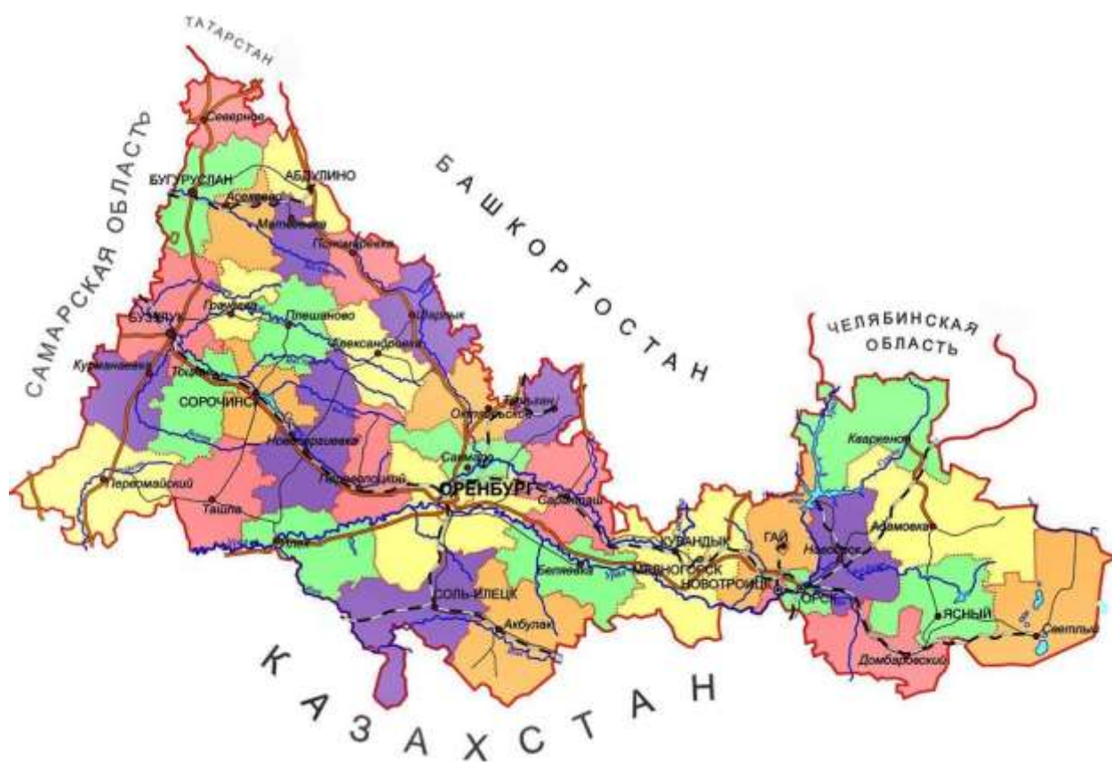
Рис.1. Карта Оренбургской области

Оренбургская область образована 7 декабря 1934 года. С 26 декабря 1938 года по 4 декабря 1957 года называлась Чкаловской. Территория области расположена на стыке двух частей света – Европы и Азии, преимущественно в предгорьях Южного Урала. Наибольшая протяженность с запада на восток – 750 км. Время: московское плюс 2 часа. Административный центр области – город Оренбург (1475 км от Москвы по железной дороге).